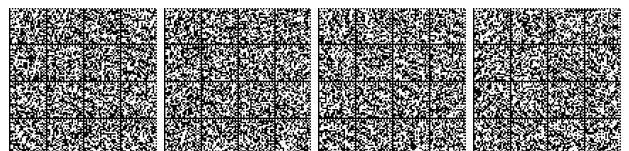
Tabella V.9-2: Compartimentazione