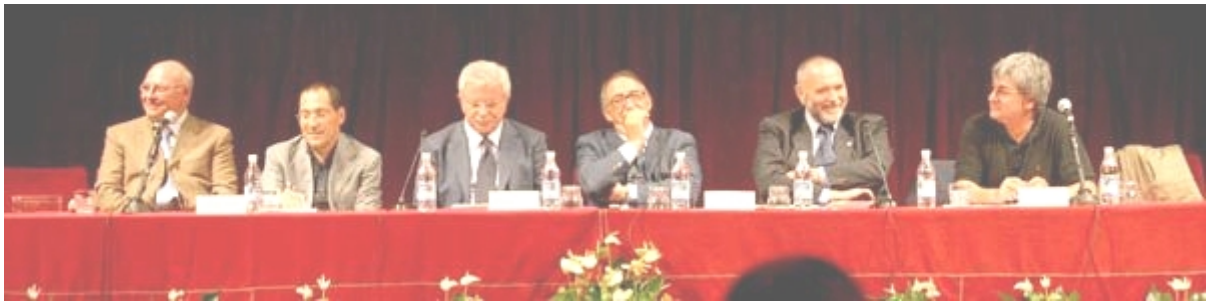
Il Tavolo di Presidenza

Gli Ordini degli Ingegneri d'Italia, riuniti in Congresso a Treviso dal 5 all'8 settembre 2006 sul tema "Ingegno creativo, innovazione e concorrenza", sentite le relazioni presentate e gli interventi susseguitesi nel corso del dibattito, nel rigettare ogni forma di ghettizzazione dei professionisti e rifiutando logiche di retroguardia culturale oltre che politica